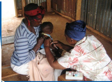
Vaccinering, en viktig uppgift för jeepklinikernas