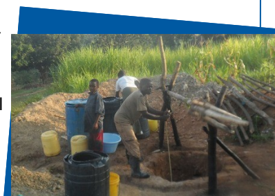
Brunnen som byggs för medel från Åhus och kostar ca 35 000 kr

I maj samlade Åhus Rotaryklubb in pengar genom att arrangera en tipspromenad och andra aktiviteter på en "Åhus går för vatten" dag. Nu grävs den första brunnen som detta projekt finansierar. I början av augusti hade man kommit ner till 21 meter och det finns gott om vatten. Över en natt fyller det på med drygt 4 meter vatten, minimum som behövs är 3 meters påfyllning, så det kommer att vara gott om vatten. Det viktigaste jobbet görs dock före man börjar gräva och det är mobilisering och utbildning av all byborna, samt fördelning av arbetsuppgifter. Bybornas arbetsinsats är viktig, då de ska känna sig delaktiga och ta ansvar för brunnen när den är färdig.