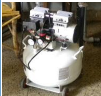
En ny kompressor till Migori tandläkarlinik

Kontakt kansliet om du är intresserad: info@doctorbank.se