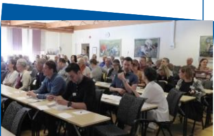
Fullt i föreläsningssalen på Läkarmötet

Det årliga mötet för läkare/tandläkare som är involverade i Rotary Doctors verksamhet ägde rum i Holsbybrunn 21-22 april. Mötet är ett tillfälle att få uppdatera sig i aktuella ämnen som gäller sjukvård i afrikanska länder. Det är också ett tillfälle för Rotary Doctors att få feedback och diskutera verksamheten med läkarna/tandläkarna. De drygt 90 deltagarna fick lyssna på föredrag om antibiotikaresistens, malaria, hudsjukdomar och kulturförståelse. Mötet organiseras av Skandinaviska Läkarbanken och Rotary Doctors som tillsammans har registret över sjukvårdspersonal.