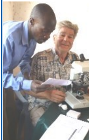
CH Pressfeldt Halmstad Distrikt 2400 Jeepläkare Mumias