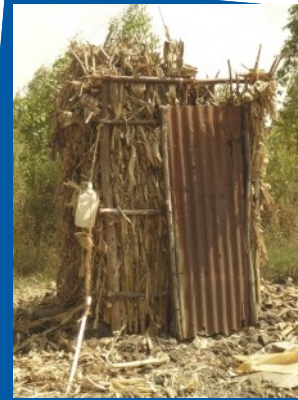
En enkel men funktionell latrin