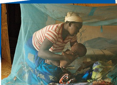
Mamma skyddar sitt barn mot malaria