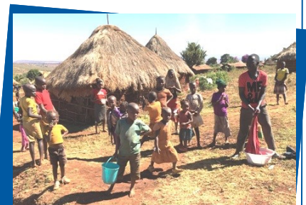
Besök verksamheten i Kenya

Vill du följa med till Kenya och besök Rotary Doctors verksamhet, se jeeplinje- och tandläkarverksamheten samt vattenprojekten? Under hösten och vintern anordnar Rotary Doctors tre resor till västra Kenya för Rotarymedlemmar samt medföljande. Programmet med Rotary Doctors omfattar fem fulla dagar, sen kan man kombinera med olika semesteralternativ. Det finns fortfarande några platser kvar på alla tre resor. Skicka ett mejl med namn, klubb och din mejladress till info@rotarydoctors.se så får du mer information.