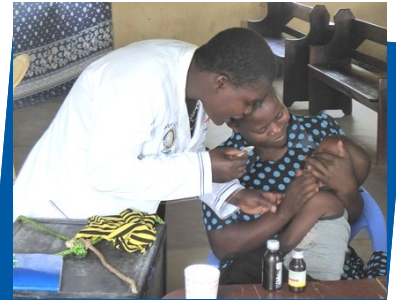
Medicinering redan på kliniken