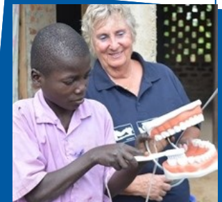
Undervisning gör nytta!