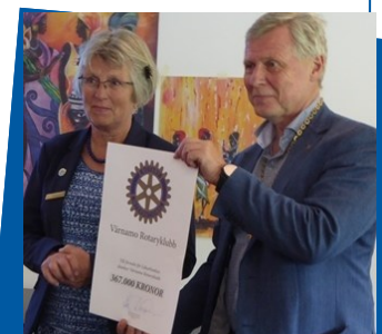
Gåva från Värnamo Rotaryklubb.