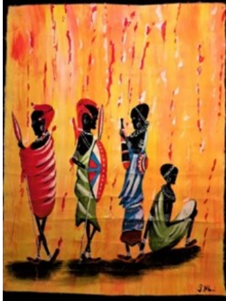
Litografi av P. Mbai