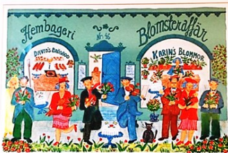
Litografi av Per-Olof Persson