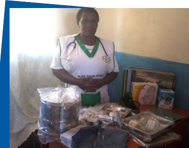
Sjuksköterskan på Marindakliniken med den nya utrustningen