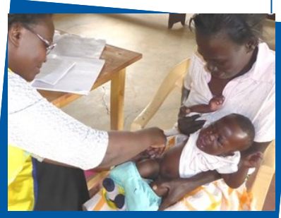
Vaccinationer räddar liv.

Den 31 oktober 1988 antogs stadgarna för stiftelsen Rotarys Läkarkbank. Läkare hade redan under våren rest till södra Afrika, och under hösten skickades de första läkarna till Kenya. Trettioårsjubileet har firats genom flera upprop till stöd för en speciell del av Rotary Doctors verksamhet. Detta kvartal handlar uppropet om stöd till vaccinering och tandläkarverksamheten. Läs mer om det i bifogat Upprop eller på sidan: https://www.rotarydoctors.se/klubbnytt/bra-att-veta-for-din-klubb/rotary-doctors-30-ars-jubileum/